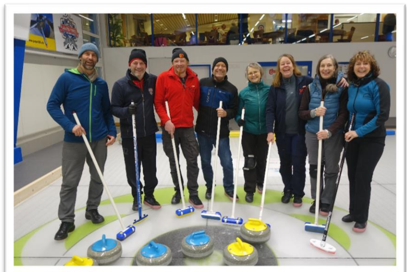
134-i – Besenhexen