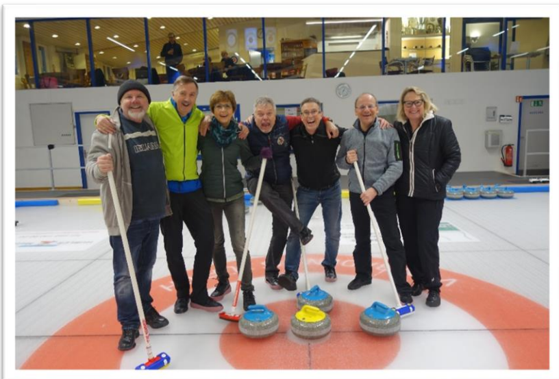
Blaulicht – Herr der Ringe